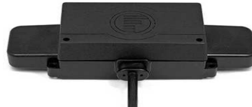
Bild: integriertes Gerät mit Schutzklasse IP65